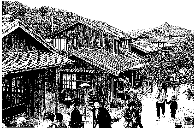
二十四の瞳映画村

旅行1日目(4月1日)は新千歳空港を出発し、神戸空港からバスで新岡山港へ向い、フェリーで小豆島へ渡り、宿泊します。2日目は、日本三大渓谷の一つ寒霞溪(かんかけい)のロープウェイで空中散歩の後、二十四の瞳映画村やオリーブ園、栗林公園を見学します。3日目は、高知を訪れ桂浜で坂本龍馬(銅像)と龍馬記念館(天候によっては金刀比羅宮)を見学後、松山の石手寺に立ち寄り道後温泉に宿泊します。4日目は、瀬戸内しまなみ海道を通り、大山祇神社(おおやまづみじんじゃ)、耕三寺を訪ね