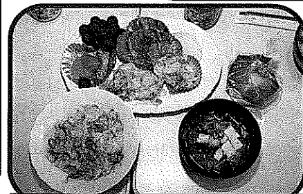
今月の昼食：きのこご飯、みそ汁、鮭の甘酢あん、 かぼちゃサラダ、煮物、白菜のゴマ和え、デザート