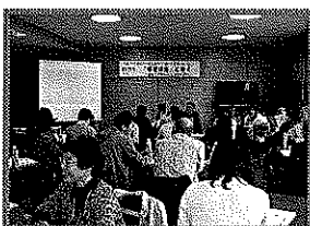
分科会開始前の歓談

ました。2日間楽しい学びの時間をいただきました。芽室町参加団の皆さん、ありがとうございました。