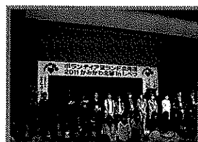
10代からのメッセージ