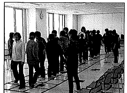
講習会（J.A.めむろ女性部もみじ会）