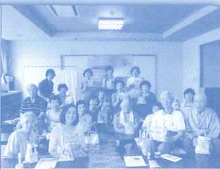
たすけあいチーム 活動の様子