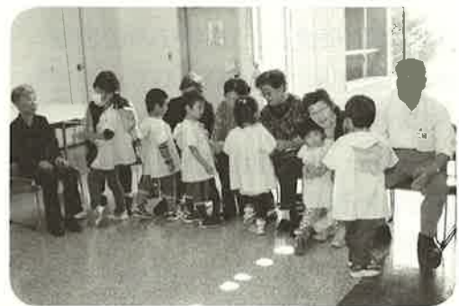
芽室幼稚園児との交流会

他にも毎月の誕生会や幼稚園児との交流会など、ひとりで暮らしていると体感できないことを盛りだくさん行なっています！