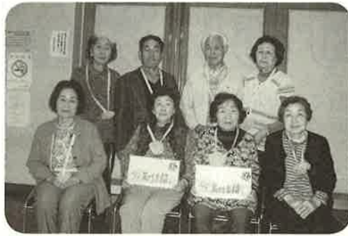
誕生会での記念撮影