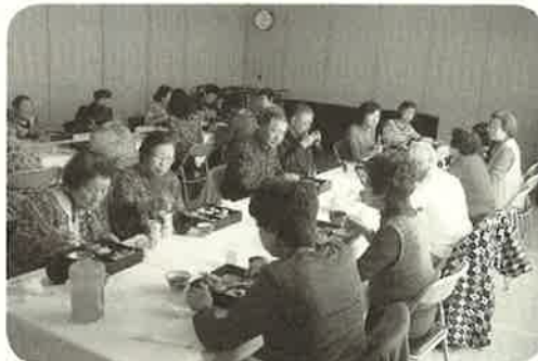
日帰り温泉旅行 (幕別町忠類)