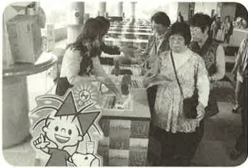
一泊旅行(札幌市他)

普段の交流会は、中央公民館で行ないますが、1泊旅行や日帰り温泉旅行、焼き肉での交流会といった楽しい行事もあります！