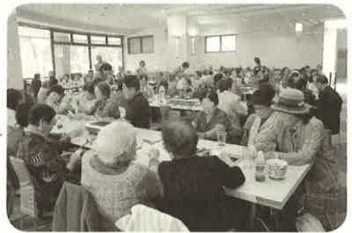
鹿追町社協との交流会

普段の交流会は、中央公民館で行ないますが、1泊旅行や日帰り温泉旅行、焼き肉での交流会といった楽しい行事もあります！