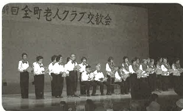
やまと 大和クラブ 合唱

全町老人クラブ交歓会は、発表や参観だけではなく、舞台の司会進行や受付といった運営の部分もすべて老人クラブ会員が担当する「自主運営」「手づくり」の発表会になっています。