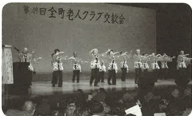
きたふしこにれ 北伏古楡の会 舞踊

11月19日、中央公民館を会場に第49回全町老人クラブ交歓会を開催しました。 今年は、25クラブから44演目の発表、560人の来場者があり、会場は熱気に包まれました。