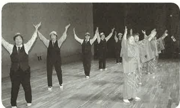
にししかりゆうあい 西士狩友愛会 舞踊