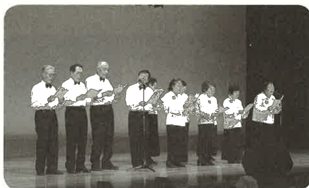
かみびせいらうゆう 上美生老友クラブ 合唱