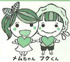
メムちゃん フクくん