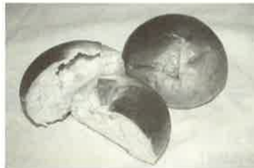
リンゴ入りカスタードがクセになる クリームりんご 110円