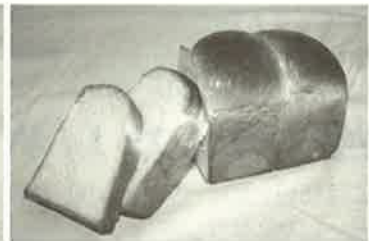
水を使わず焼き上げました！ ミルクワンローフ 400円