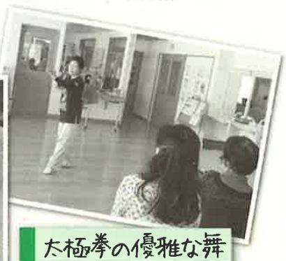
大極拳の優雅な舞