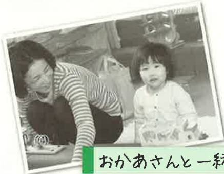
おかあさんと一緒に