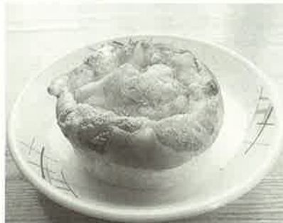
ジャガイモが入って、食べ 応え充分！辛さもGood！ 【いもメンタイ(150円)】

アットホームパン工房 「リスどん」 「なごみ」出張販売は7月31日(木) 10時30分～12時です