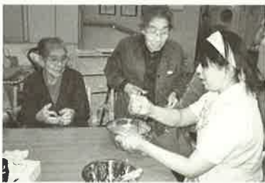
■気分は、パティシエ・菓子職人です■