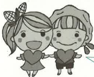
メムちゃん フクくん

「グループホーム東めむろふれあい館1」では、利用者さんと一緒に散歩して下さるボランティアを募集しています！