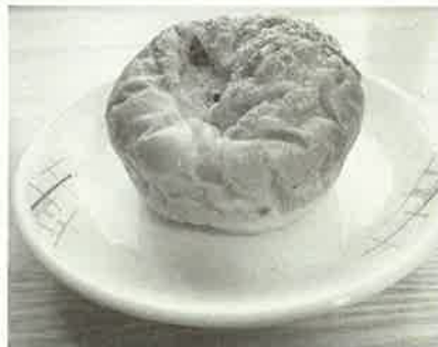
先月新発売のカレーパンに辛さをグッと深めました！ 【大辛カレーパン(150円)】