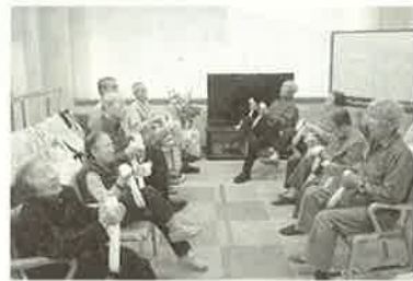
■内容を週毎に変えています■