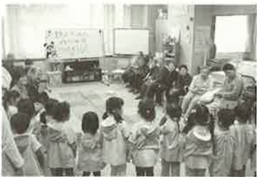
■3月には、利用者様が「メムちゃんフクくん」の貼り絵を作り、芽室幼稚園の卒園生へプレゼントしました。■