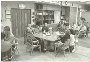
■思い思いにゆったりと過ごされています■