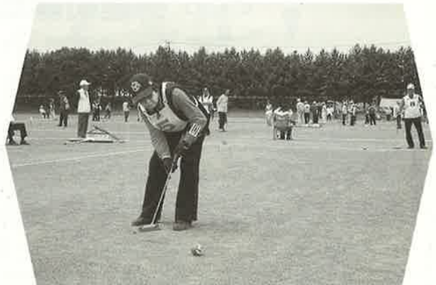
我がチームの勝利に向かって真剣勝負 6/27(金)十勝地区老連ゲートボール大会