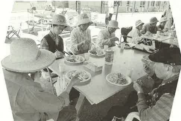
庭の植物を眺めながら穏やかに 6/25(水)ふたば・デイサービス合同食事会

芽室町社会福祉協議会は、総務係(芽室町共同募金委員会、あおぞら芽室会)、地域福祉係(芽室町老人クラブ連合会、芽室町ボランティアセンター、ふれあいサロン「なごみ」、身体障害者福祉協会芽室町分会)、訪問介護係・障がい者支援係(ホームヘルパー)、通所介護係(「あいあい21」デイサービスセンター)、居宅介護支援係(ケアマネジャー)、小規模多機能型居宅介護係(ふたば)の7係で構成されています。