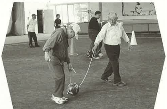
運動を通じ、仲間と楽しく交流 7/11(金)身障分会スポーツ大会