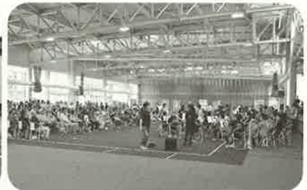
※写真は、昨年度のものです