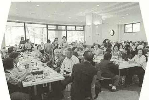
大勢で囲む焼肉は格別の味 7/10(木)ふれあい交流会【鹿追町との合同交流会】