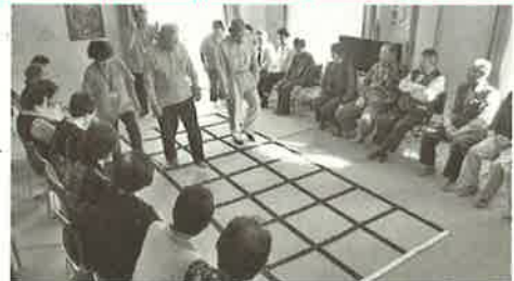
西土狩友愛会での講習会の様子