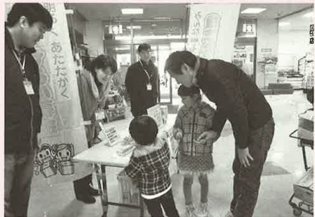
めむろーど内にて

多くの皆様からご協力をいただき、95,697円の募金が集まりました。ご協力いただいた皆様に心から感謝申し上げます。