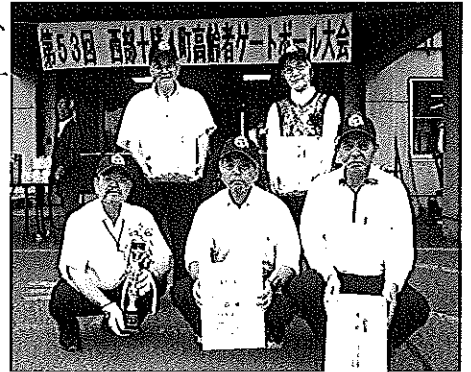
栄へ優勝した チーム