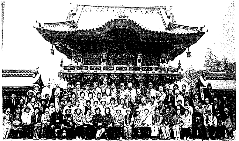
昨年度訪れた耕三寺での記念写真

旅行1日目(3月31日)は、新千歳空港を出発し、羽田空港から知識寺を経て戸倉上山田温泉に宿泊します。2日目は、善光寺をお参りした後、松本城や高山市内を見学し、高山温泉に泊まります。3日目は、白川郷合掌村や輪島を訪れこの日は和倉温泉に宿泊します。4日目は、千里浜(ちりはま)ドライブウェイを通って金沢市内観光、そして草津温泉に泊まります。最終日のメインは634mの高さにそびえる東京スカイツリーに登って